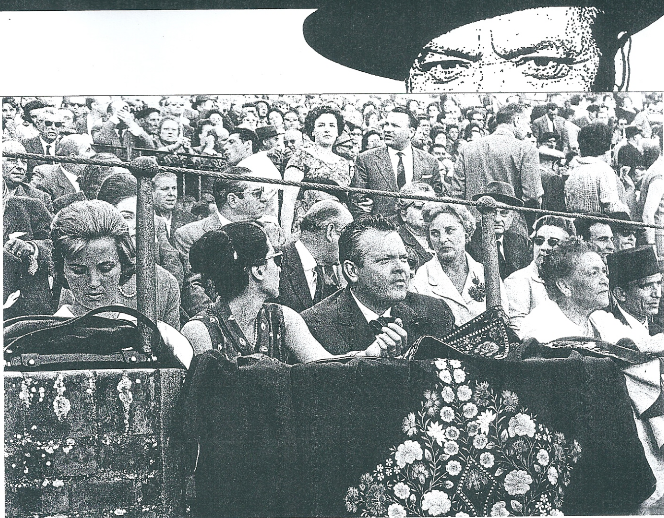
Welles en los toros. A la izq. en la plaza de toros de Ronda, con Julio Aparicio y Antonio Ordóñez. Sobre estas líneas en Sevilla (1967).

La segunda propiedad de vuestro soberbio jerez es calentar la sangre... El jerez la caldea y la hace correr del interior a las extremidades. Y así es como el príncipe Hal tiene valor, porque la fría sangre natural que heredó de su padre, él la ha regalado y abonado, cual un terreno desnudo y estéril, con generosos tragos del fértil jerez; y así que ha vuelto ardiente y bravo. Si yo tuviera mil hijos, el principio humano que les enseñaría, es abandonar toda la bebida ligera y dedicarse por entero al jerez". ( Campanadas a medianoche . Temas de cine)