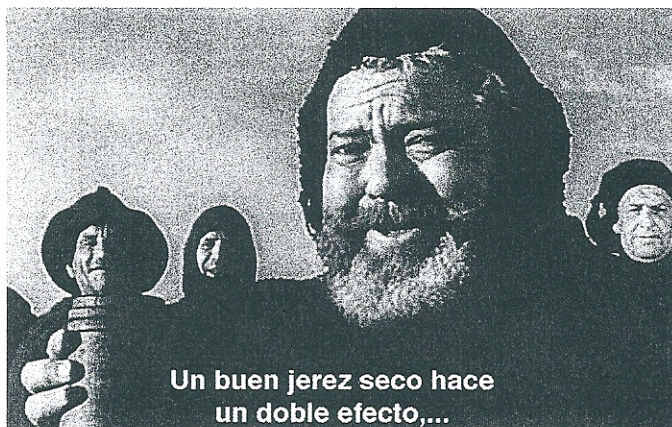
Secuencia de "Campanadas de medianoche" (1965), en la que Falstaff elogia el vino de Jerez.

Si seguimos a su biografía, Barbara Leaming, sus colaboraciones periodísticas y literarias para revistas de su país le permitieron mantener ciertas comodidades en la ciudad andaluza; entre otras, alquilar un piso aunque fuera encima de una "ruidosa casa de putas" (sic; pág. 74); en otras ocasiones, Welles ha precisado que su vivienda estaba en Triana aunque no recordaba el lugar exacto. De otra parte, sea ello histórica verdad o mejorada leyenda, su interés por la tauromaquia le llevó a torear en diversas corridas con el nombre de "el americano", no sin antes haber pagado a un empresario sin escrúpulos su inclusión en la terna. Como, sin duda, se le daban mejor las tablas de un